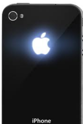
背面ライトアップ例

なお、カスタムと修理の技術は全く同じですので、修理を学ぶと、カスタムも同時に可能になります。