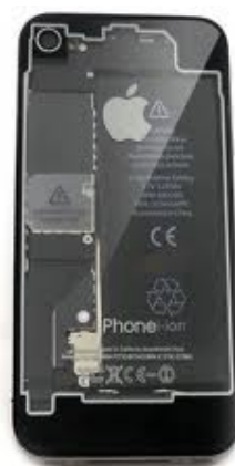
ブラックスケルトン カスタム例

iPhoneカスタムは、アップルショップでは行っておりませんので、高額なカスタム料金を頂くことが可能です。